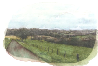
LUCILE CORBEILLE - PAYSAGES DILUÉS